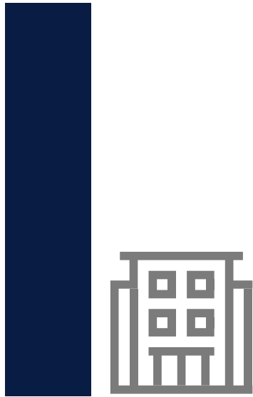
Edificio Insignia Lab